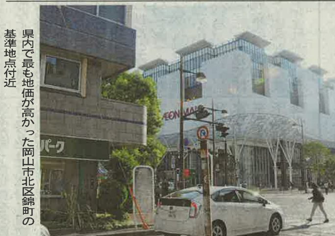
県内で最も地価が高かった岡山市北区錦町の基準地価付近

県内の基準地価はここ数年で2割以上高騰している。東京や海外からも投機対象としての引き合いが多い」と話す。一方、同市の表町地区はマイナス2.6%で、市内の商業地30地点の中で最大の下落率を記録した。地価から見れば「イオン効果」は一部にとどまっており、市街地全体に波及させるには、官民ともに回遊性向上などの努力が求められる。さらに県中北部になると、土地需要はまだ